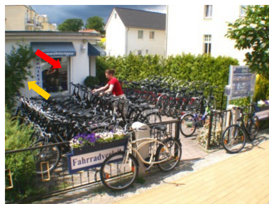
Unser Büro: Waldstraße 33 in 17429 Seebad Bansin

Schritt 3. Schlüssel entnehmen, Klappe schließen, Ziffern verdrehen, Platte hoch schieben!